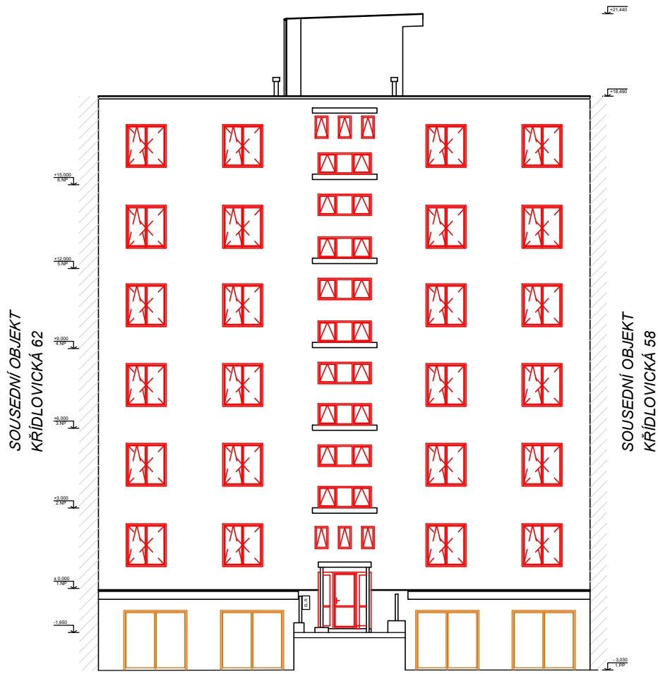
POHLED Z UL. KŘÍDLOVICKÁ